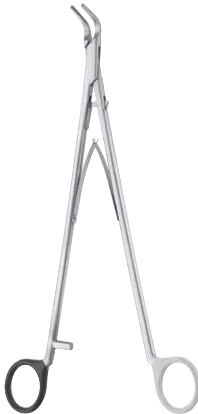
FC230R - FC231R Clip Applier X-large, length 280 mm Clip Anlegezange X-large, Länge 280 mm