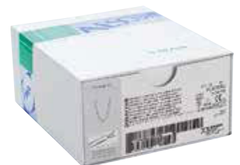
PL475SU Titanium Ligation-Clip, X-large (z) 12 cartridges of 4 clips Titan Ligatur-Clip, X-large (z) 12 Magazine à 4 Clips