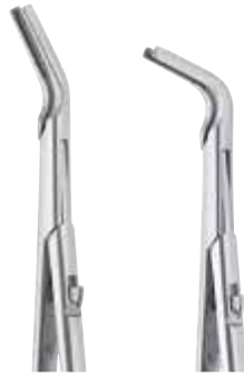
FC230R FC231R 25° 65°