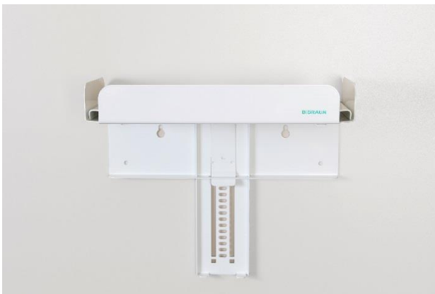
Halterung in geschlossenem Zustand.