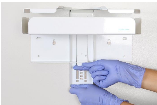
Halterung entriegeln und die Öffnung mit der Führungsschiene nach oben schieben.